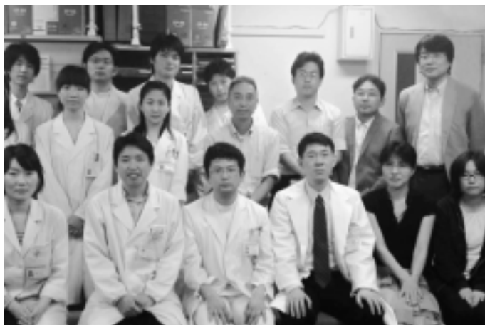
写真 1. SP (Schizophrenia Project) 研究メンバー集合写真 前列右から 3 人めが筆者.